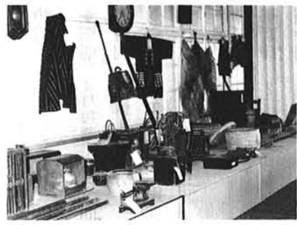
◀ いろんな民具が 展示してあります。

町にのこっている民俗資料をいつまでも大切に保存しておこうと町の文化財審議委員会では、この度、別院境内にある公民館の二階に民俗資料室を作りました。