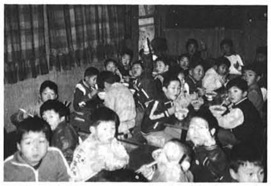
◀ お雑煮を食べて鏡開き