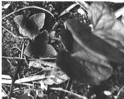
▲コシノカンアオイ ▼コシノカンアオイのつぼみ