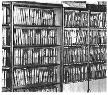
▲部屋にはフィルムがいっぱい

地域の映写会や学校の教材などで使われる16ミリフィルムが、視聴覚ライブラリー三島分室に沢山そろえてあります。