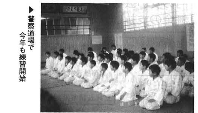
▶ 警察道場で 今年も練習開始