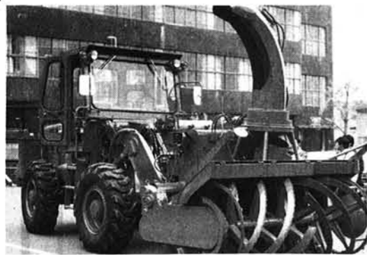
新兵器 ロータリー除雪車

◎ 除雪コースは、例年通りですが、降雪量その他の都合により変更することがありますので、ご承知願います。 ◎ 午後十時から翌日の午前二時半までは、原則として除雪しない方針になっています。