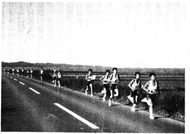
▲力走する中学男子マラソン

これで中学生生活の思い 出がまたひとつふえました。 これからもたくさん思い い出をつくり、またそれを 大切にしていきたいと思 います。