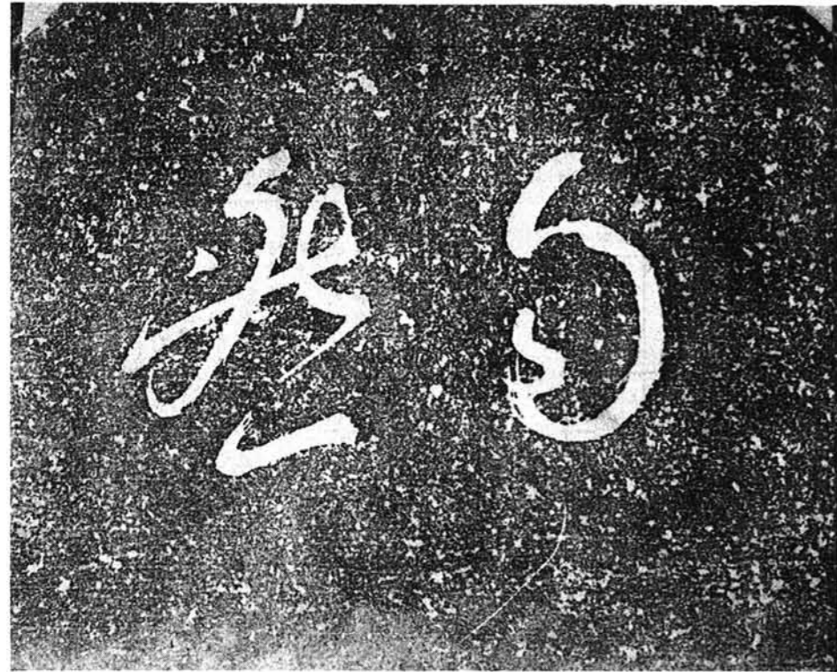
常念寺(蓮正寺の内寺(まえでら))歴代の墓碑銘として、良寛さまに書いてもらったものだそうです。この常念寺は、橋以南の父・新木五右衛門富竹の実家・山田家の菩提寺であり、そんな関係で、良寛さまがこの寺へしばしば遊びに来られ、そんなある日、住職に頼まれて、良寛さまは筆をふるったのであろうと思われる。

昭和51年5月10日 ■発行/与板町(代表者/与板町長川上文平) ■編集 与板町だより編集委員会