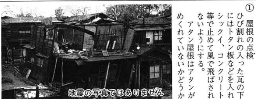
地震の写真ではありません