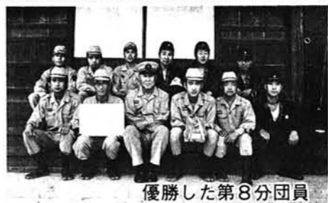
優勝した第8分団員