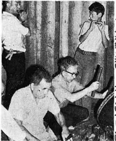
9月 もつと川を大事に……大人といつしよに 与板祭も近い……