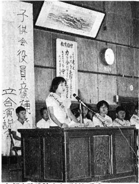
与板小改造論もとびだしそうー 子供会役員選挙