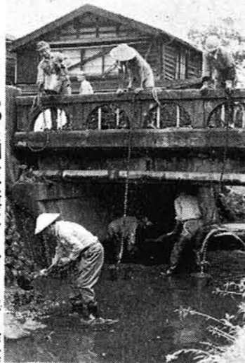
もつと川を大事に……ヘドロ取り作業