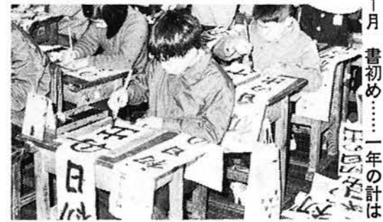
1月 書初め……一年の計は