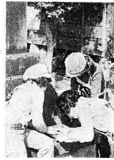
R点発見次は…… オリエンテーリング大会