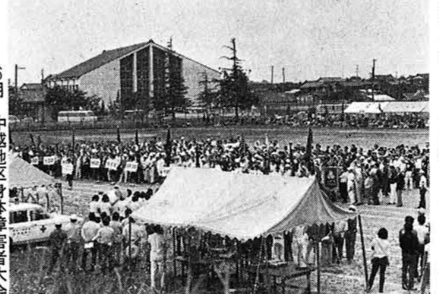
6月 中越地区身体障害者大会