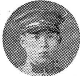
君 吉 藤 井 藤