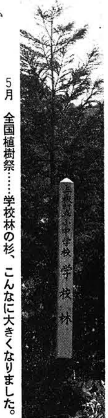
5月 全国植樹祭……学校林の杉、こんなに大きくなりました。