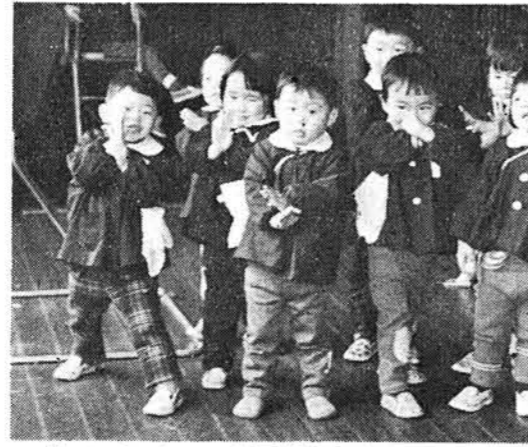
「ヘンチン」……全国の変身ブーム