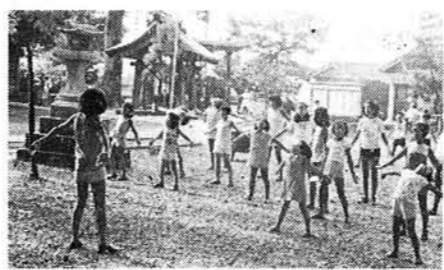
8月 アクビといつしよにラジオ体操