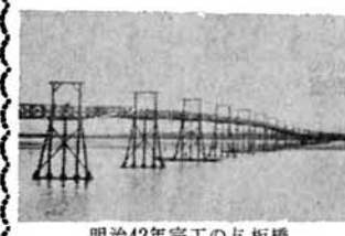
明治42年完工の与板橋