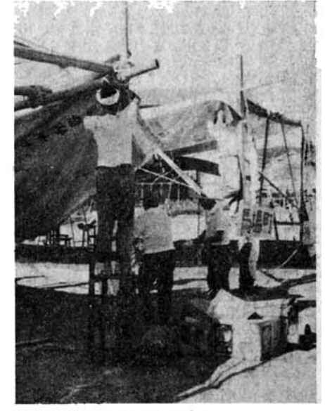
応援席はおとうさんたち……