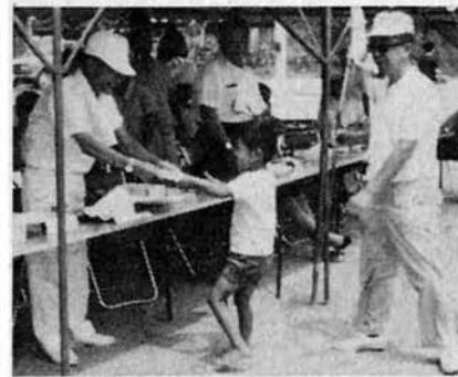
一等賞おめでとー

毎年青空を見ることのできなかつた……七月二十三日は朝から熱気溢れる大空の下第二十五回町民体育祭が中学校グラウンドにて行なわれまわした。この体育祭を通して町民の連帯感意識の高揚に役立った。それに住民個々の新陸と融和にもこの一日は大いに役立った。参加町内会は二十三町内。日頃、運動に縁のないとうちゃん、かあちゃんそれにおとしよりもかけつけてさかんに声援と飛び入り参加。競技が進むにつれて、手に汗をにぎる熱戦がくりひろげられた。来年もできれば屋外で……参加者全員の声。