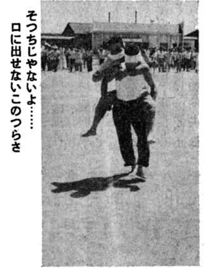
そつちじゃないよ……口に出せないこのつらさ