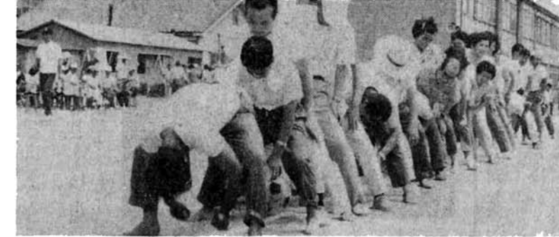
いつたぞーとびださないようにネー