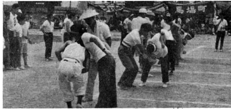
手をつかわないように……

毎年青空を見ることのできなかつた……七月二十三日は朝から熱気溢れる大空の下第二十五回町民体育祭が中学校グラウンドにて行なわれまわした。この体育祭を通して町民の連帯感意識の高揚に役立った。それに住民個々の新陸と融和にもこの一日は大いに役立った。参加町内会は二十三町内。日頃、運動に縁のないとうちゃん、かあちゃんそれにおとしよりもかけつけてさかんに声援と飛び入り参加。競技が進むにつれて、手に汗をにぎる熱戦がくりひろげられた。来年もできれば屋外で……参加者全員の声。