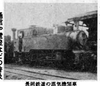
長岡鉄道の蒸気機関車

このように、橋がかかり鉄道が敷かれ、通信機関が発達し、電燈や人力車・自転車が利用されるようになったのは、与板にとつて生活の大きな変化であり近代化であったでしょう。