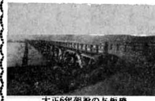
大正6年架設の与板橋

明治末期から大正年代にかけて日本の近代化は一層すすみ、国際的地位も高まりました。与板では橋梁・鉄道の敷設や電燈・電話などの設置は、町民の生活に大きな変化をもたらしたのです。 与板橋の架設 長い間、信濃川の渡し船は不便が多く、悲惨な事故もあり、その上中之島方面との交流も多かつたので、信濃川架橋の請願が、明治中頃より十七年間近く行なわれまわした。漸く、明治四十二年に新潟の万代橋の古材を使って、全長五九三メートルの与板橋が完工しました。ところが橋梁は古材のため破損がひどく、大正五年に破壊してしまつたので、町は積極的に運動し県事会で架橋費が可決され