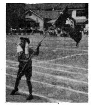
フレイ・フレイとうちゃん!!