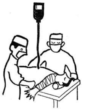
七月は愛の血液助けあい運動月間です

● 献血者のしおり 1 採血手順 血液センターの受付では、献血者名簿、献血者カード及びチャート等を作成し、献血者としてのカード及びチャートを持って診察室で診察を受け、ここで採血の準備が整います。採血の準備が整った人は採血室へ移動し、腕の静脈から採血します。採血時間は三〜五分、痛くはありません。採血が終了したら、休養室でしばらく休んでいただきます。 2 採血の不安感を除くには 献血に対するご理解と協力的な意欲があつても、二〇〇mlという採血量について不安感を持たれる人が案外多く見受けられますが、これは人体と血液量との関係を知れば、決して心配することはないといふことがわかります。 人体の全血量は男子の場合、概ね体重一キロにつき七三・二ml、女子の場合で六七・七mlとされており、二〇〇mlです。採血一回の採血量は二〇〇mlですから、体重五五kgの男子を例にとれば、その人の全血量は四、〇二三mlで、採血量はその二〇分の一に当ります。また、体重七〇kgの男子の場合、二五分の一程度です。一回の採血量が全血量の一〇％以内であれば、普通何等悪影響はないといわれています。 3 移動採血車や出張採血のやり方は 移動採血車は、ある人数がまとまって献血を希望される場所へは、どこでも出向いて行つて採血されます。この場合採血車を車で行なう場合は、採血手順は血液センターの場合と殆んど変わりません。また、一度に多数の献血者がある場合に、出張採血といつて現場で適当な部屋を利用して、そこで採血されます。採血手順などは、血液センターの場合と殆んど変わりません。 4 採血された血液はどのような処理されるか 採血された血液は、検査室で、血液型の検査が行なわれ、このとき、A B O 式の検査と、R h 式の検査と、両方が行なわれます。また、梅毒の検査や肝機能検査も行われます。検査に合格した良質の血液は、常時摂氏四度〜六度の温度を保つようになつて、冷蔵室に貯えられます。これが保存血液です。保存血液は、さらに梅毒感染の可能性を防止するため、最低四日間はそのまま冷蔵室に貯えられて、採血後五日目から使用することになつていきます。 5 献血のできない方は 次の各項に該当する方は献血することができません。 1. 血液の比重が一・〇五二に達しない方。 2. 満十六才未満の方、満六十五才以上の方。 3. 過去一カ月以内に輸血の目的で採血を受けた方。 4. 妊娠している方、また 過去六カ月以内に妊娠していたと認められる方。 5. 体重が男子で四十五kg未満、女子で四十kg未満の方。 6. 最高血圧が一〇〇/ミリメートル(水銀柱)以下の方(低血圧の方)。 7. ヒロポン、麻薬中毒の方。 8. 有熱者、健康状態の悪い方等。 その他今までにこれはという病気がかかったことのある方は、検診にたずさわつて、医師におたずね下さい。 ● 血液代金の自己負担分の支給について 血が流れた方や同居の親族の方が万一事故や病気で保存血液の輸血を受けられた場合の血液代金のうち、社会保険や国民健康保険等から支払われる分を除き、自己が負担した分について日赤支部で支給することになりました。 ● 採血車「ゆうあい号」来町のお知らせ 日時 七月二十四日(土) 午前七時より午後三時 会場 与板町消防本部協働協力下さい。