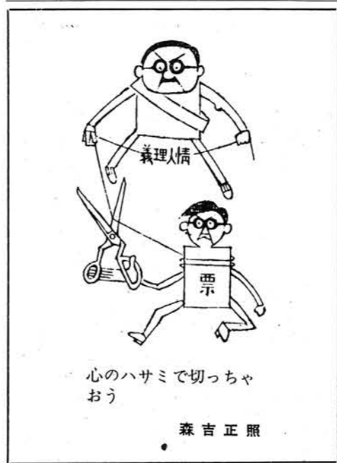
心のハサミで切っちゃおう

不在者投票は印鑑をもって選挙においてになれば請求手続きがすみ投票もできます。尚、出稼している人、長期出張している人など他の所で投票する人は郵便で請求することになります。この請求は告示前でも請求できますので早めに請求して下さい。