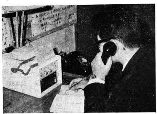
してありますので従来どおり御協力をお願いいたします。

与板町消防本部に消防用無線が設置されました。 災害や災害の恐れのある重要情報等が迅速にキャッチでき、緊急事態をすみやかに広報でき、指令系統が迅速かつ正確に伝わり、消防活動が一層充実したものになります。 現在消防本部無線室に無線局とハンドトーカーが、消防車一台(一号車)と救急車に移動局がそれぞれ設置されております。 「ピーポーピーポー」は救急車です。火災の場合のサイレンと區別するた め、救急車のサイレンを「ピーポーピーポー」に変えました。 この音はかなり遠くからも聞こえますので、この音が耳に入ったら緊急車がきたんだということを考えて、どうか救急車を優先させて下さい。この「ピーポー」サイレンは道交法でも緊急車と指定