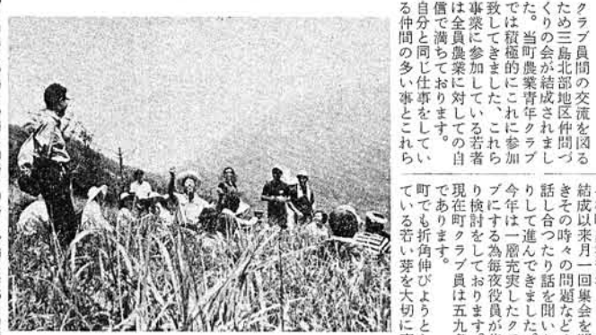
仲間一人一人が農業に対して前向きな考えを持つていて、前向きな考えを持つていて、前向きな考えを持つていて...