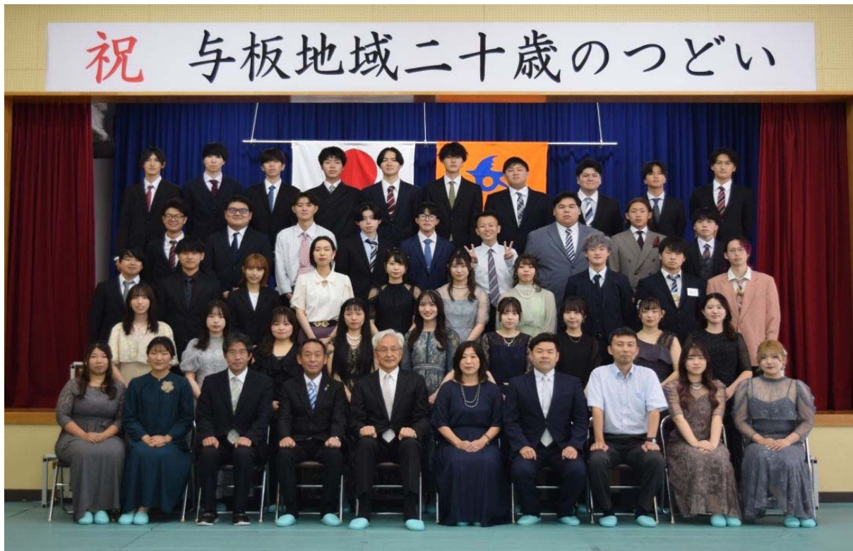
(8月15日 与板地域二十歳のつどい)