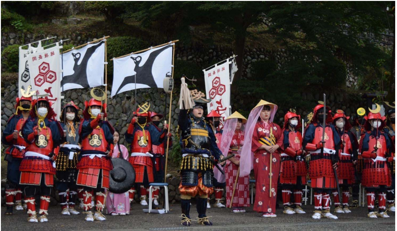
(10月8日 与板天地人行列)