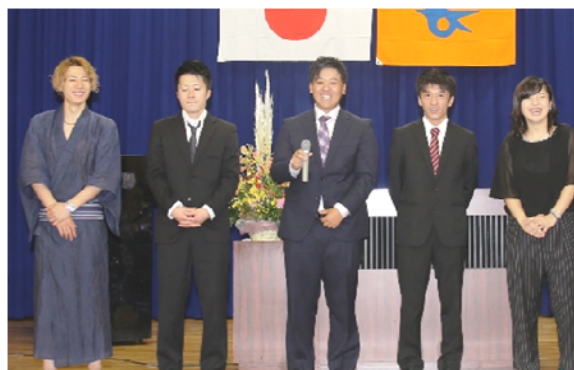
▲自らの近況とこれからの抱負を述べる代表者

与板地域成人式が行われ、スーツやドレス姿の新成人81人が、引き締まった表情で式典に臨みました。