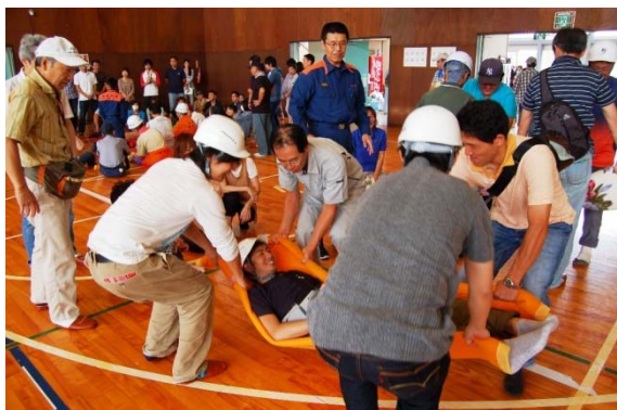
▲救急救命の講習を受ける重点地区訓練参加者