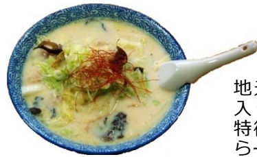
地元産の豆乳入りスープが特徴の「お船らーめん」