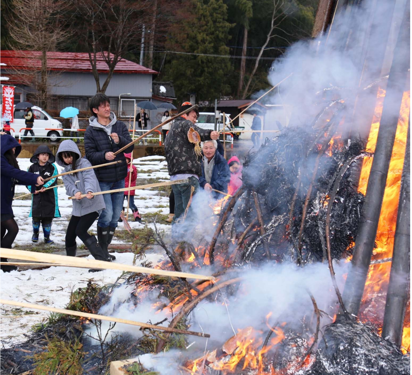
燃え上がる炎でスルメを焼く来場者