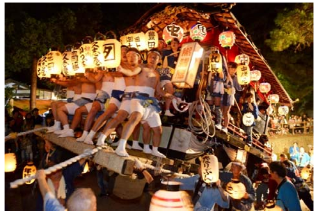
最優秀賞「登り屋台」

秋晴れに恵まれ「第2回与板町内看板めぐり」が実施されました。与板ガイド会の方々から地名の由来や名所旧跡等のいわれなどを聞きながら、参加者同士の交流も図られ、達成感に満ち溢れた看板めぐりとなりました。(10月19日)