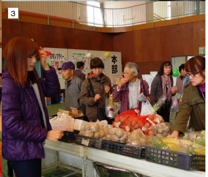
1 「農林産物品評会」には 24 品が出品 2 長蛇の列で売り切れとなった「きのこ汁販売」 3 盛況だった地場産「農林産物・花きの販売」 4 多くの家族連れが楽しんだ「おもしろ釣りぼり」