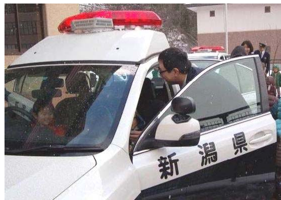
↑ パトカーに乗ったよ ぼくたちも おまわりさん!