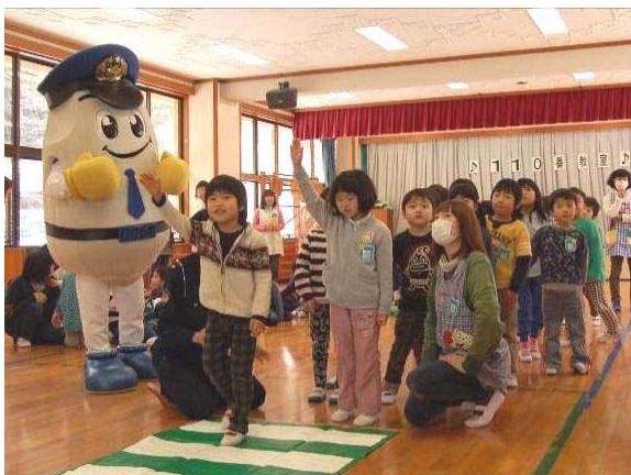
↑ しっかり手を挙げて、自分を大きくみせよう!

与板幼稚園で「110番の日」にあわせ、与板警察署の署員らが110番通報の仕方や横断歩道の渡り方を丁寧に指導しました。(1月10日)