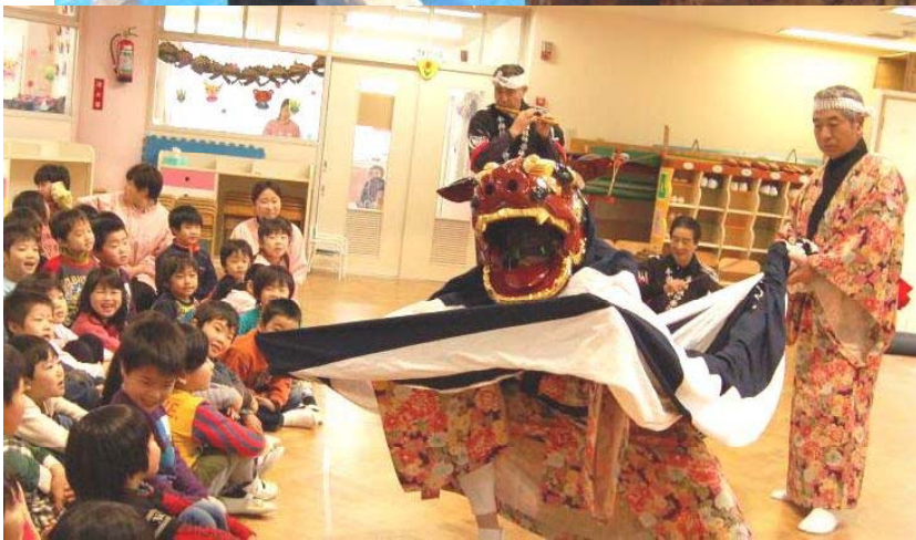
↑本与板神楽保存会による神楽舞の披露 子どもたちはドキドキを笑顔にかえて、大きな歓声を上げていました

与板保育園でもちつきが行われました。 祖父母有志らが企画し、今回、4回目。 本与板神楽保存会やツよいったーが登場し会場を盛り上げました。(1月22日)