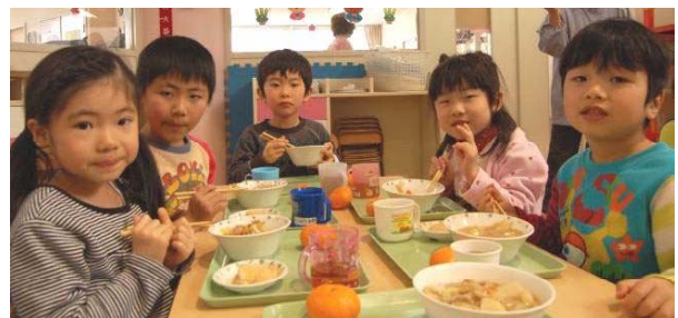
↑早速、きな粉もちとお雑煮に おいしい☆