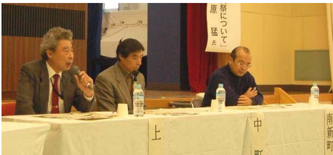
↑ 町内会代表から屋台についての思いが熱く語られました