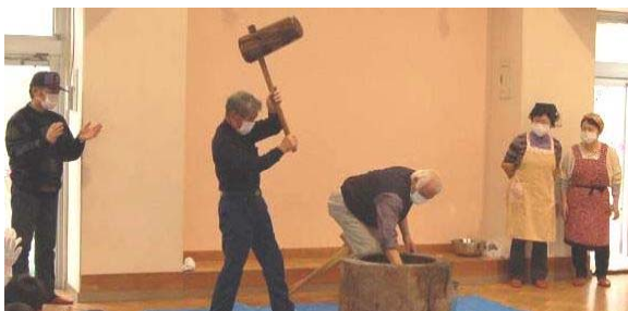
↑仕上げはおじいちゃんパワー！ よいっしょ！