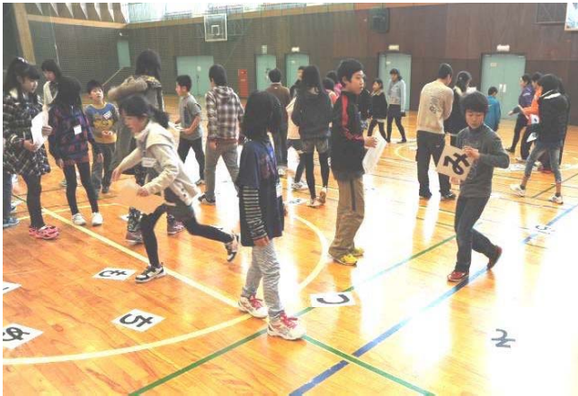
↑ みんなで文字探し！ 文字カードゲームの様子