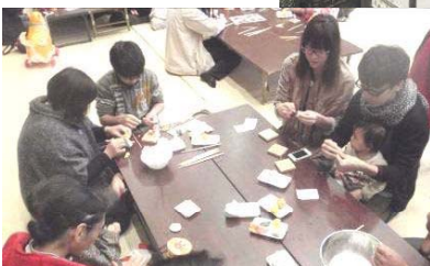
←ちんころ作りに熱が入ります