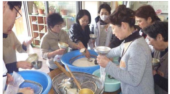
↑与板分団が講師を務めたハイゼックス袋での炊き出し