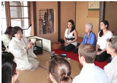
↑平成24年度補助交付団体「なごみの会」 楽山亭を定期的に開放し、伝統文化の体験や呈茶などで訪れた方のおもてなし活動を実施