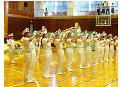
↑ 「交通安全 Yoita 大会・コンサート in 与板」(9月22日)

「チビっ子指導隊」(与板幼稚園年長児)が元気に登場。(9月25日、28日) また、与板町交通安全協会主催の「交通安全 Yoita 大会・コンサート in 与 板」では、県警音楽隊と与板中学校吹奏楽部のコラボ演奏を楽しみました。