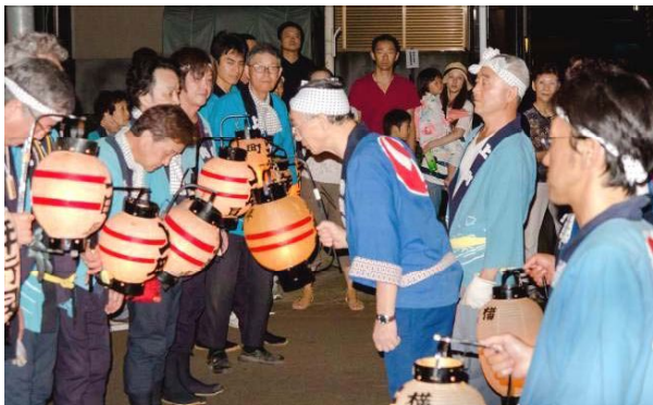
↑北新町神楽組、屋台組が述べる口上も伝統の慣わし祭礼の奥深さを感じる、緊張感漂う瞬間だ