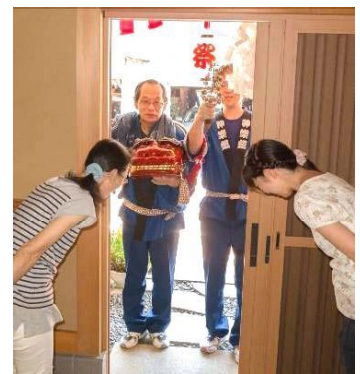
↑各戸で悪魔を祓い、五穀豊饒・商売繁盛・家内安全を祈願

「私たちにとっての祭は、無事を祈り、祓い清めるとい使命を肅々と果たすこと」 華やかな祭にはもう一つの表情があった。