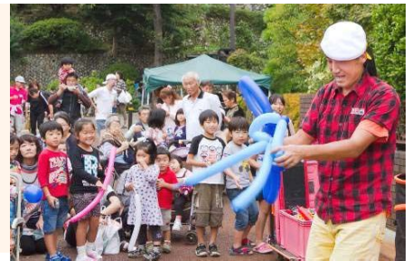
↑ バルーンパフォーマンス

天地人行列をさらに盛り上げようと、与板観光協会主催による 「与板観光まつり」では、お船なべのサービスや演歌の祭典な ど、子どもから大人まで楽しめるたくさんの催しを開催。華やかな 一日となりました。