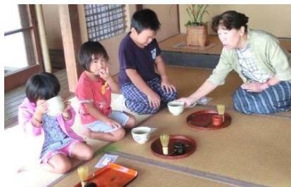
←平成23年度、「なごみの会」による「楽山苑活性化事業」では、年間約1,300人を呈茶でもてなすなど、大変喜ばれました。

※募集要項は4月1日以降、支所に備え付けます。(長岡市のホームページからもダウンロードできます。ご利用ください。)