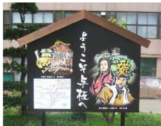
↑与板支所前案内看板

各町内会それぞれの思いや趣向を凝らした特徴ある看板となっています。地域内の散策がてら看板めぐりをしてみてはいかがでしょうか。