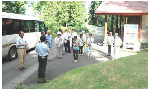
←第2回会議地域内施設視察(うまみち森林公園)