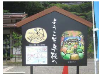
↑楽山苑前案内看板