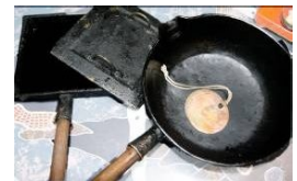
↑ 明治の鍋と黒豆の色を美しくする円形の銅板