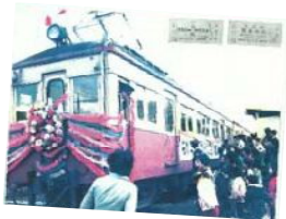
←昭和50年 廃線当時の写真

越後交通長岡線の電車や切符等の記録写真を見て、イメージしながら陶板制作を行いました。