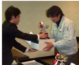
↑総合優勝の江西2丁目

11月21日には、今年度最後の地域対抗スポーツ「カローリング大会」を開催しました。