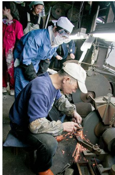
↑職人の技を間近で観察