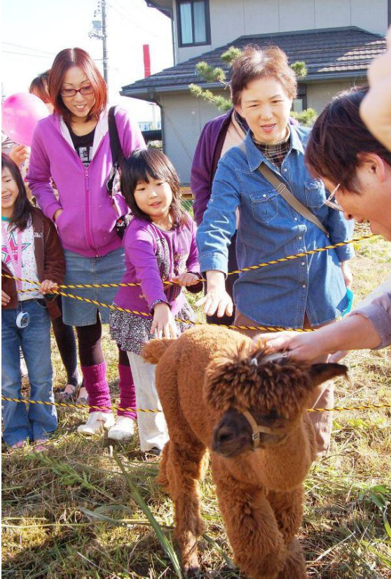
↑「ぬいぐるみみたい〜」山古志地域のアルパカは大人気