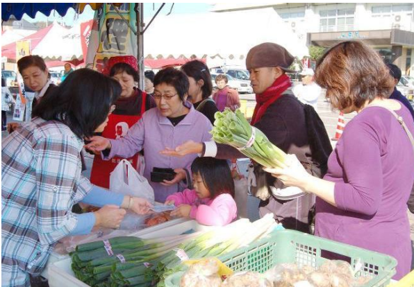
↑新鮮で安心な地元野菜が大特価！