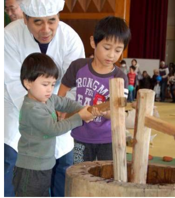
↑おいしいお餅になあれ！