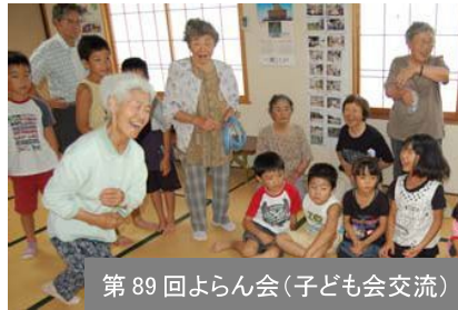
第89回よらん会(子ども会交流)

体をはぐしたら、あとはその日のお楽しみ。歌、ゲーム、工作など、工夫がいろいろ。花見や旅行にも出かけます。 「よらん会」のモットーは、互いの良い所を出し合ってやること。持ち前の趣味や特技で誰もが先生です。 笑顔が元気をくれるから、また来たくなる、また頑張れる。今日も優しい空気が会場を包んでいます。(7月16日)