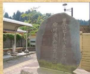
▲中川清兵衛生誕碑 (与板中町駐輪場)