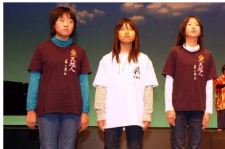
←創作劇は7場面に分け、場面ごとに3人がナレーションを担当