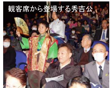
観客席から登場する秀吉公