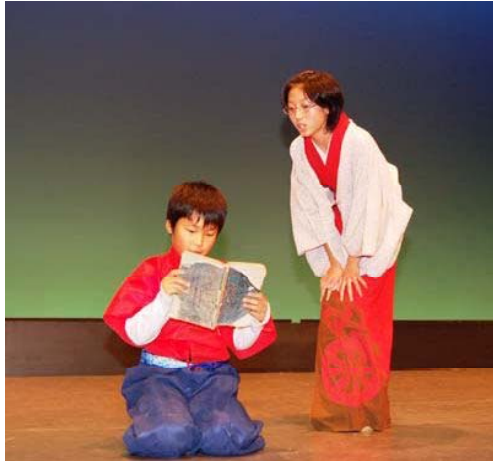
←学問好きの与六を見初める仙洞院

よいた支所だよりカラー版は長岡市ホームページでもご覧になれます http://www.city.nagaoka.niigata.jp/shisei/o-yoita/