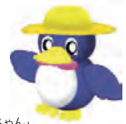
長岡の環境キャラクター「ベギーちゃん」