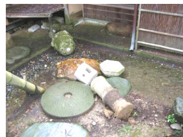
◀倒壊した楽山苑の灯籠

与板勤労青少年ホーム (壁ひび割れ、駐車場一部陥没等)、楽山苑 (壁ひび割れ、灯籠転倒、竹垣倒壊、観音堂広場内亀裂等)、中町駐輪場 (通路一部陥没)、うまみち森林公園キャンプ場 (管理道路亀裂等)、与板ふれあい交流センター (多目的ホール天井・壁ひび割れ等)