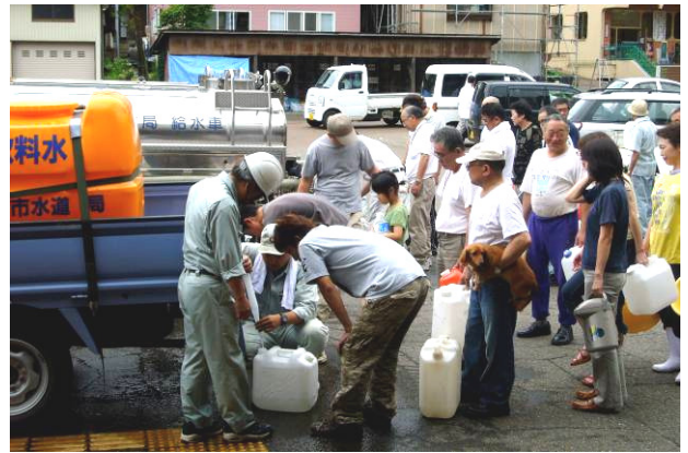
▲与板支所前での給水活動の様子 (7 月 16 日)