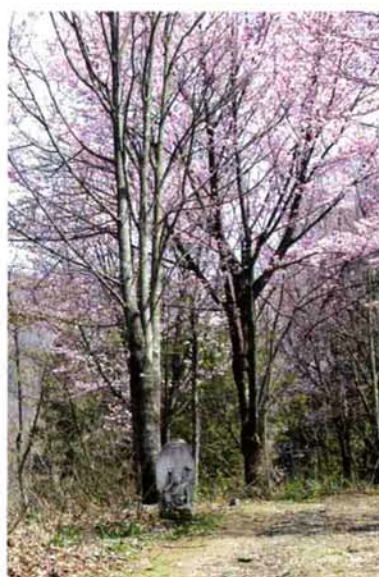
上杉景勝公と直江兼統公が米沢へ行くまで居た上田庄(現・六日町)坂戸城、坂戸山の登山道に点在する石仏と桜並木です。