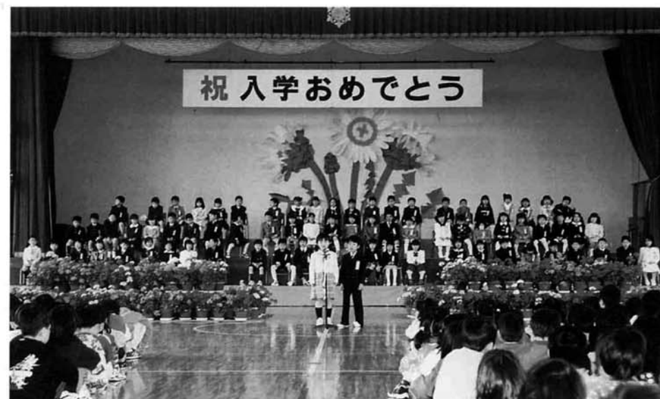
祝 入学おめでとう