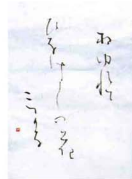
東條 シズ (吉津)