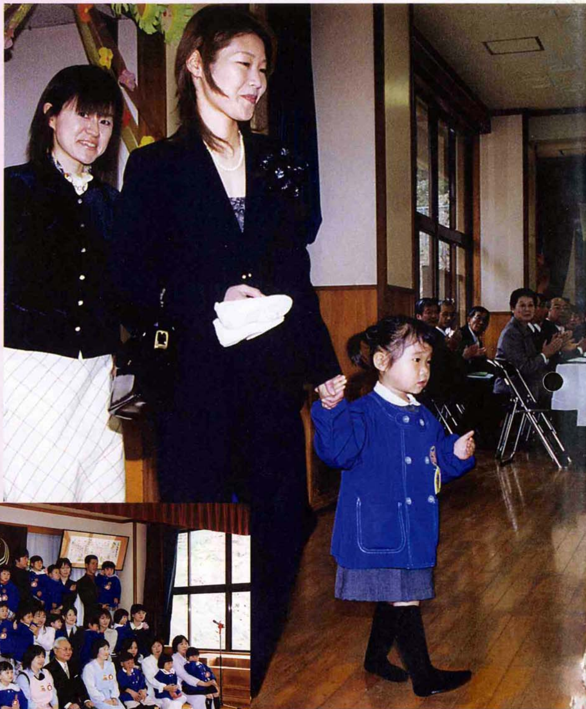
(4月8日、幼稚園入園式)