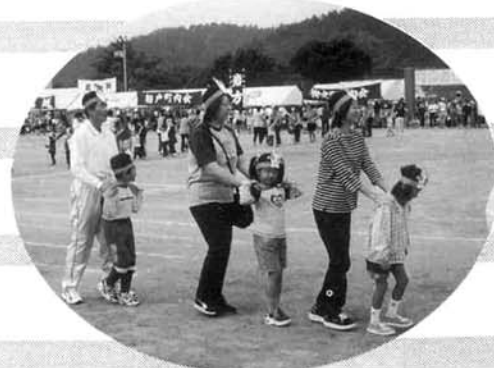
親子参加のマスゲーム

得点種目の他にも幼児レースや、〇×ゲームといったフリー参加の種目もあり、競技に参加した皆さんだけでなく、応援に訪れた皆さんも含めて、団結し、盛り上がった1日でした。