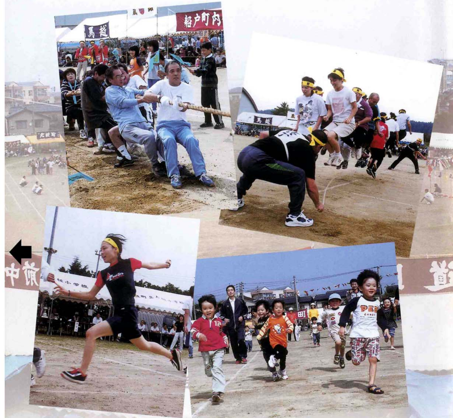
10月6日 協力し、競い合い、 親睦を深めました。(町民体育祭)