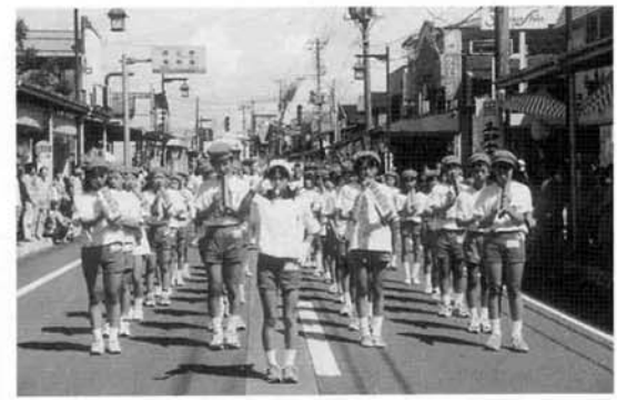
▲テクニカル/リズムカル/ 鼓笛隊とブラスバンドパレード