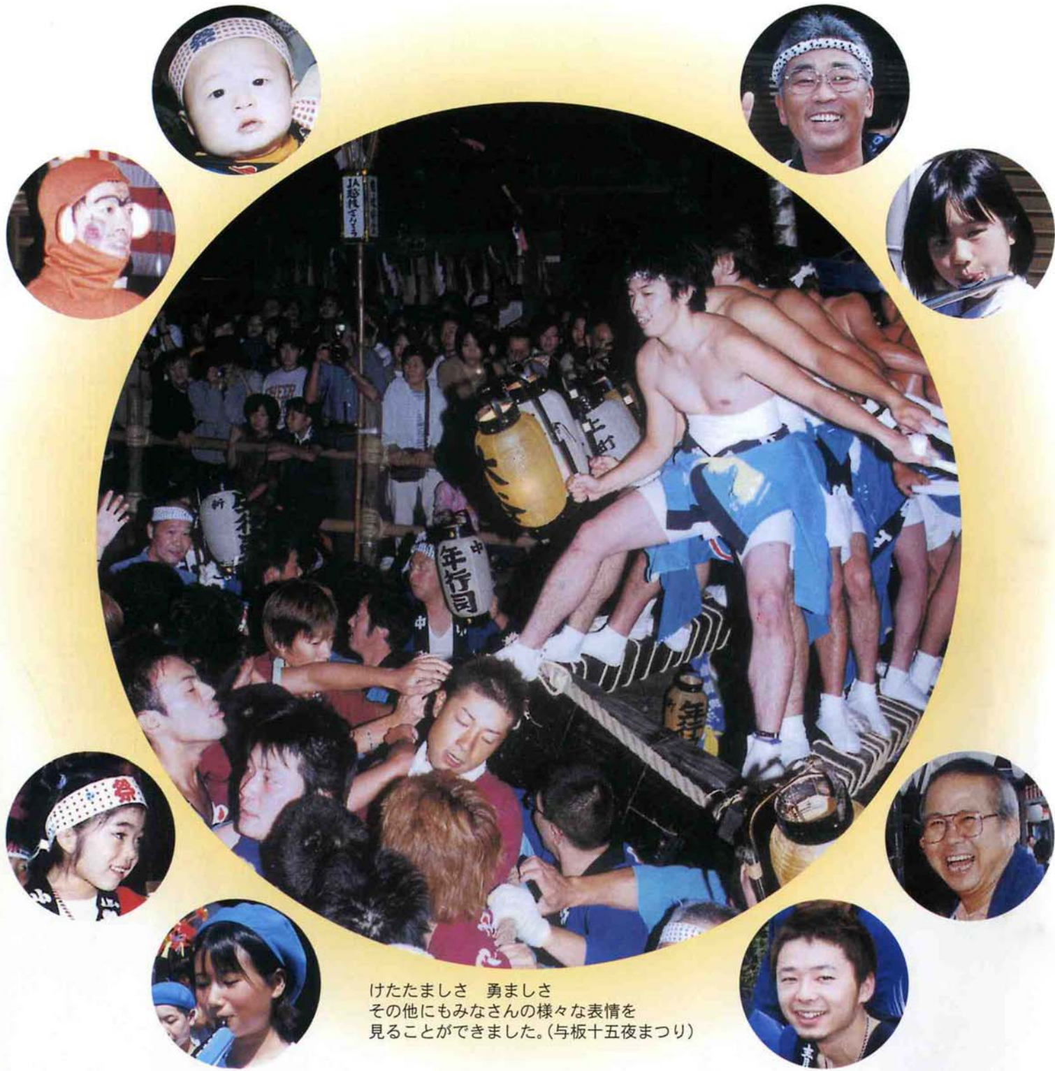
けたたましさ 勇ましさ その他にもみなさんの様々な表情を 見ることができました。(与板十五夜まつり)