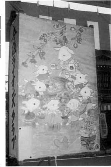
▲町を飾った 絵灯籠