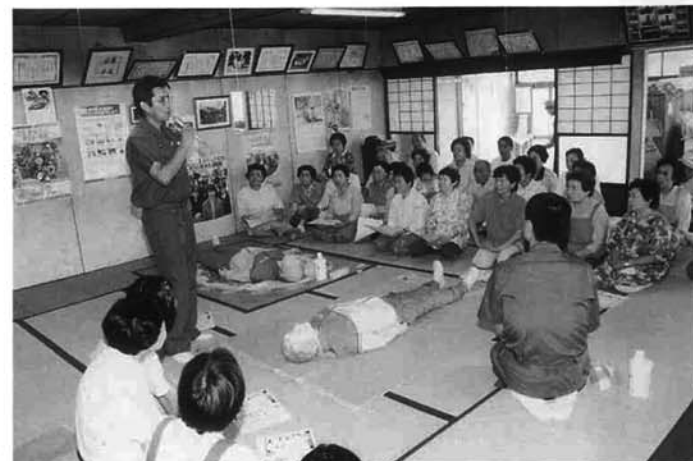
救命講習会 (H11 防災訓練より)

町では昨年、防災マップを作成し、各ご家庭に配布いたしました。この機会に今一度ご確認を！