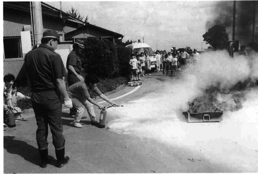
消火器による初期消火訓練 (H11 防災訓練より)

防災です。自分がけがをしてしまったら、人を救助したり、火事を消したりすることもできません。災害時にけがをしないためにも、家の中の家具を固定したり、非常持ち出し袋を用意したり、また、消火器など機器の取り扱いを熟知しておくなど、家庭での防災をしっかりしておくことが大事です。こうした個々の家庭での防災が、実は町全体の防災力のアップにもつながるのです。