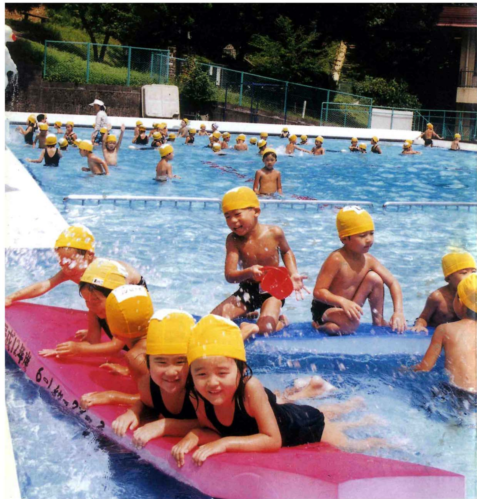
与板幼稚園のプール遊びの様子！みんな楽しそうですね。