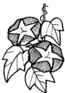
(生涯学習推進会議委員)

おなかの底から元気と勇 気が湧いてくる、読み出し たらやめられない本音痛快エッセイ集!