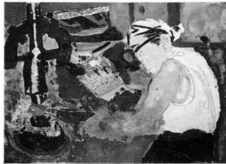
▶五十嵐恵さんの作品