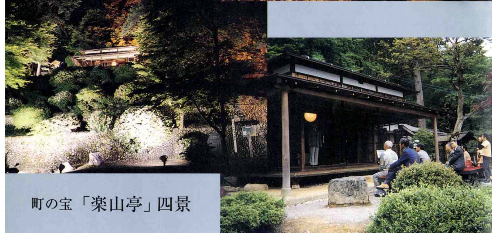
町の宝「楽山亭」四景