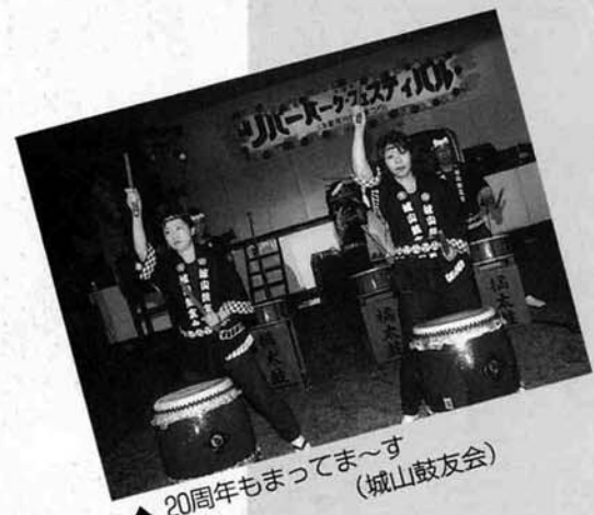
▲ 20周年もまっす (城山鼓友会)