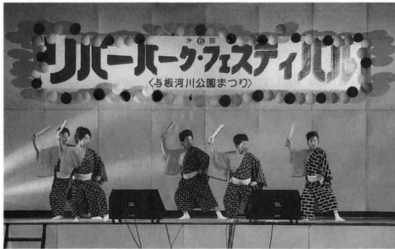
▲ いつもながらの艶やかな演技 (伊達舞踊研究会)