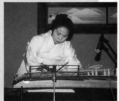
何度聞いてもいい音色ですわ〜