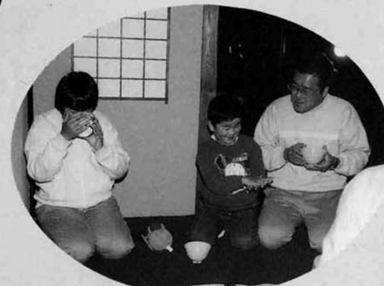
▲ ボクも一服いただきました