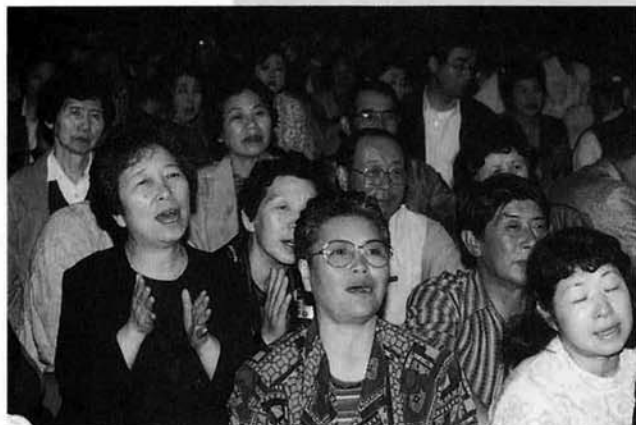
◀ 思わず一緒に唄っちゃっわ