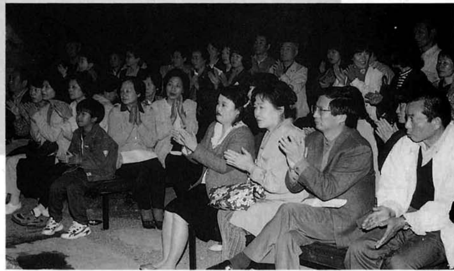
▲ しばし時を忘れて……