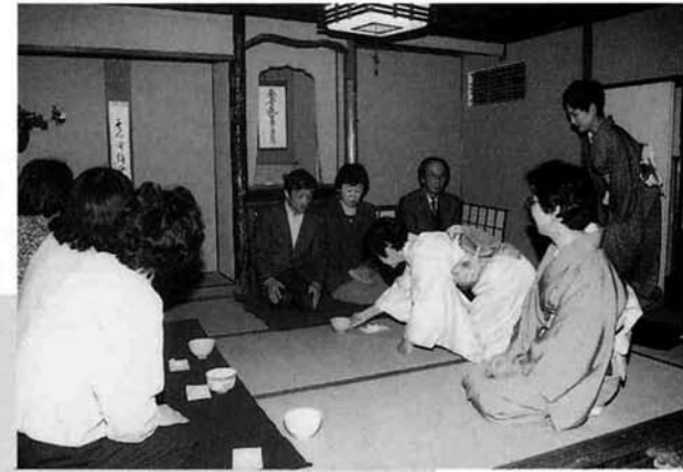
▲ 毎回好評です。「与板石州会」のお茶