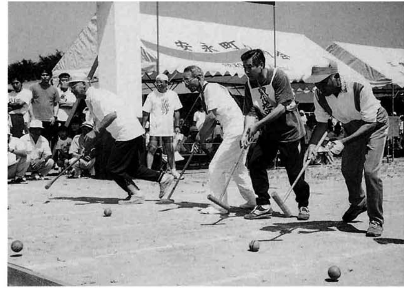
▲気持ちはせいでもよ〜くねらって