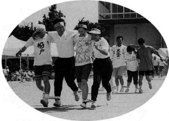
▶揃いはちまきで「フマイト」!