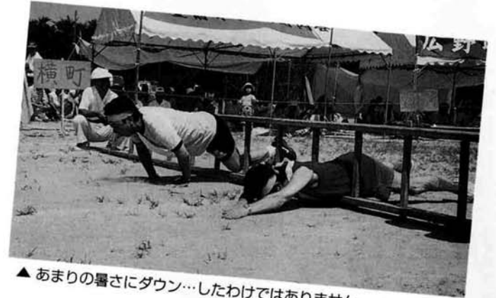
▲あまりの暑さにダウン…したわけではありません