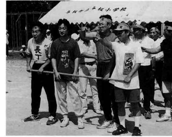
▲「あのイス4つとも回るのか」「そうです」