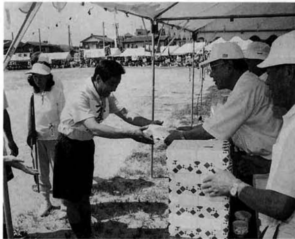
▲「賞品を 笑顔で受け取る 体育祭」