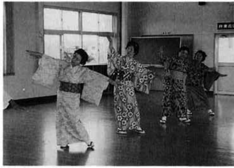
楽しみです。週一回の練習

私達の踊りの会は、美容と健康をモットーに、和氣あいあいと毎週1回の練習をしています。 踊りを始めてから腰も背もまがらず、又、素晴らしい仲間の皆さんとの練習日が来るのが楽しみで待ち遠しい位です。 高齢者になってきました。が、和敬を養い、これからも踊りを続けたいと思っております。