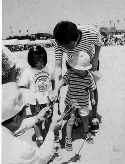
▲「この色でしようかな」(幼児レース)