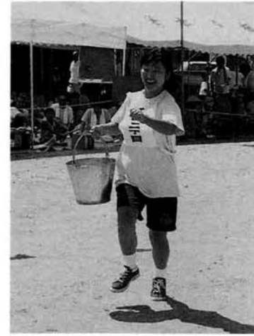
▲水の重さもなんのその