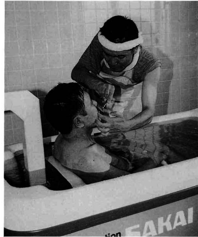
▲志保の里荘デイサービスのコマ

人間である以上年をとることは避けて通れない道であり、いくつになっても住み慣れた場所で元気に暮らしたいという願いは、だれしもが持っていることでしょう。