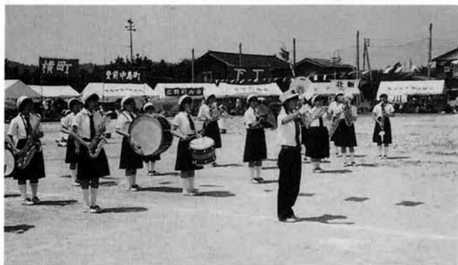
▲すばらしい演奏がグラウンドに響いていました (小中学校マスゲーム)