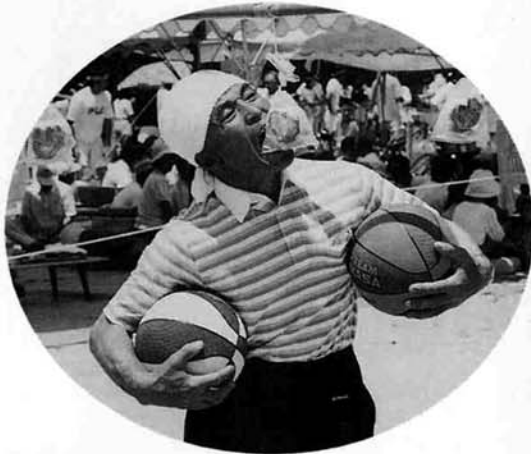
▲バンはこうやってもき取るのです