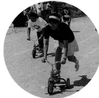
▲童心に返って楽しそう?