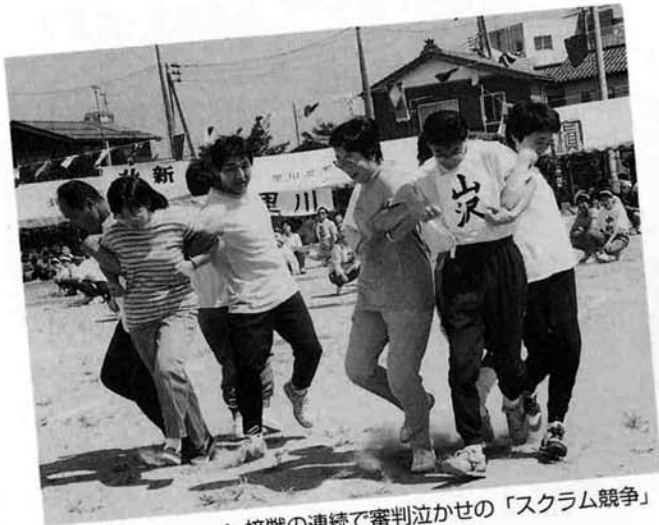
▲接戦の連続で審判泣かせの「スクラム競争」