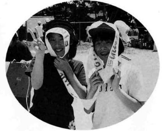
▲直射日光は女性の敵よネ!