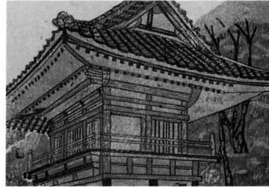
鐘突堂 坂口文夫 (馬場丁)