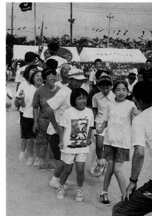
▲ スポーツの基本は「楽しく」ですね