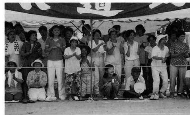
▲ この声援が選手のパワーにつながります