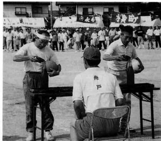
▲ どっちが早い、水入れ競争には珍しい？ 接戦