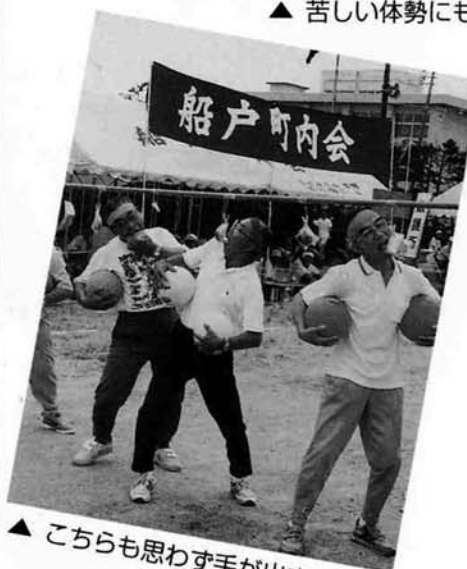
▲ こちらも思わず手が出ます

町民体育祭だけがされた方は、教育委員会へご連絡ください。(1回の通院でも保険が適用されます。) ☎ 72-3528・3945