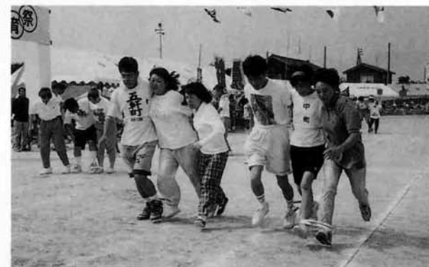
▲ 町内のチームワークがものをいう二人が五脚競争