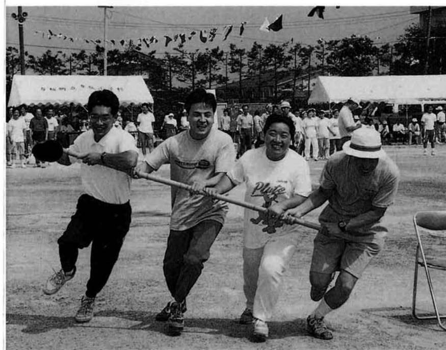
▲ 回るコツが難しい、新種目「台風の目リレー」