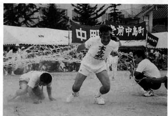
▲ 町内のためなら、たとえ火の中アミの中