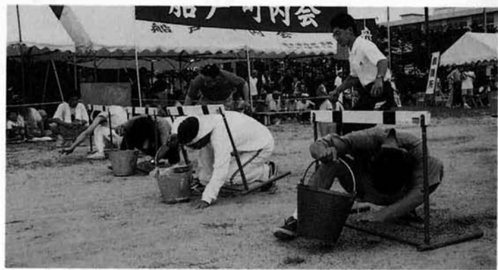
▲ 苦しい体勢にも水の量が気になります