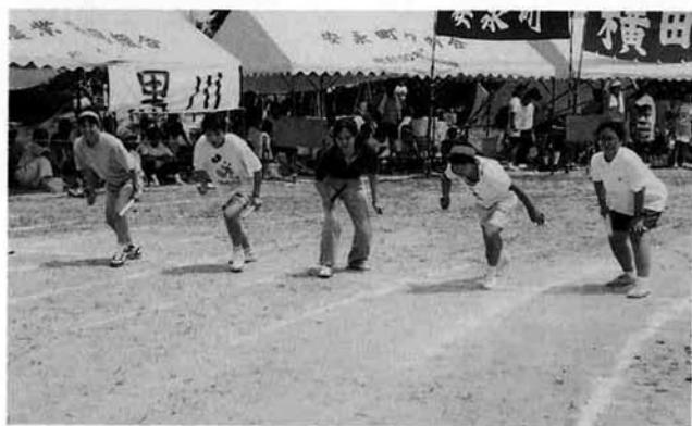
▲ スタート前はドキドキ、緊張の夏……

お昼近くには太陽も顔をのぞかせ、暑い日差しと強風に悩まされましたが、新種目の台風の目リレーや、砂ほこりを上げて疾走するF3レースなど、前日に開幕したアトランタオリンピックの影響か、気分は五輪選手の老若男女がゴール目指して熱いレースを繰り広げました。