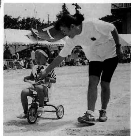
▲ がんばって！ 思わず手が伸びます