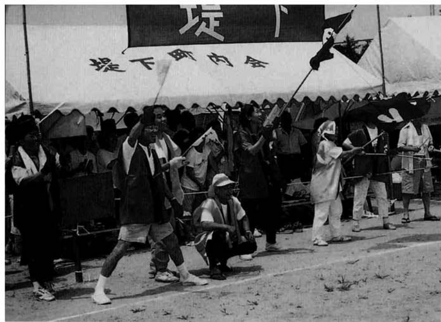
▲ すっかりお馴染みとなった堤下応援団、2年連続応援の部優勝