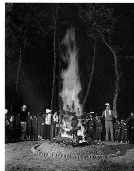
＝親子で、グループで楽しもう＝