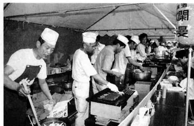
▲ 今年も売れましたバザール店