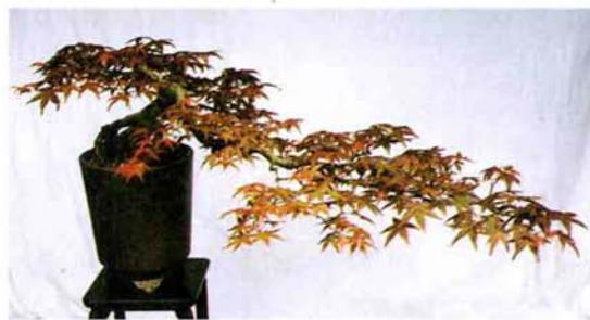
出 狸 々 (樹令 30年) 池 田 茂 雄 鉢：ウ泥懸崖雲足