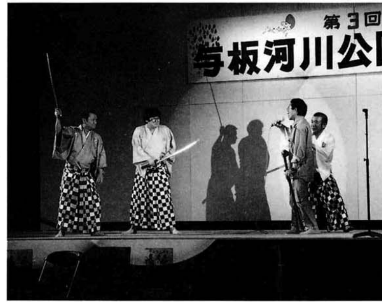
▲ お客を巻き込んでの爆笑チャンバラショー

すっかり春の風物詩となった第3回河川公園まつりが、新装オープンした河川公園で5月26日に行われました。