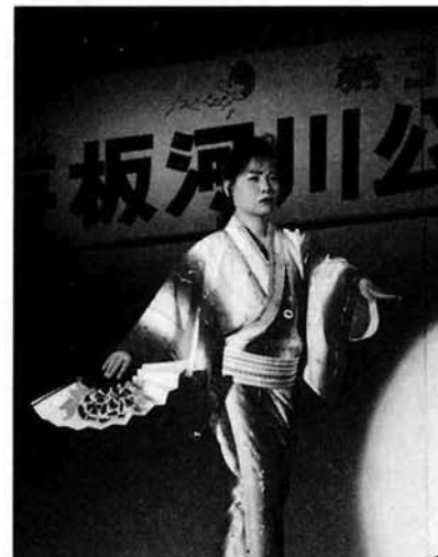
▲ 艶やか! 伊達舞踊研究会

午後6時からは野外特設ステージで、恒例となったたちばな太鼓のオープニングで幕を開け、演歌やジャズのオンステージに新舞踊、そしてお笑いチャンバラショーなど盛りだくさんのイベントを、酒を酌み交わしながら心ゆくまで楽しんでいました。