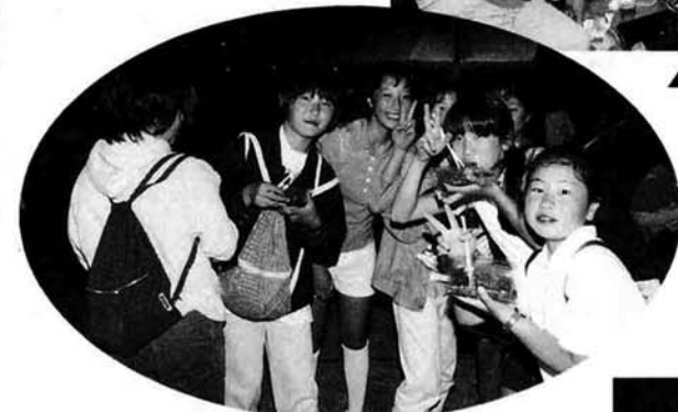
▲ この一杯がタマリマセン!