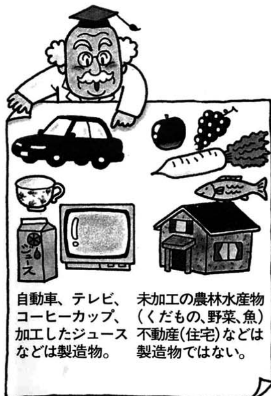
自動車、テレビ、コーヒーカップ、加工したジュースなどは製造物。未加工の農林水産物(くだもの、野菜、魚)、不動産(住宅)などは製造物ではない。