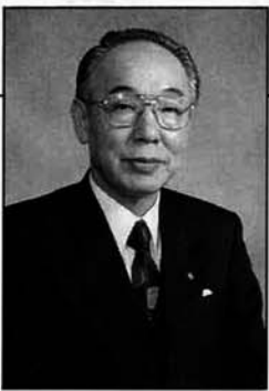
与板町長 平澤甚九郎

町民の皆様、新年明けましておめでとうございます。平成六年の年頭にあたり謹んでご挨拶を申し上げます。皆様には希望にあふれる新年を迎えられ、ますますのご健勝とご繁栄を心からお慶び申し上げます。