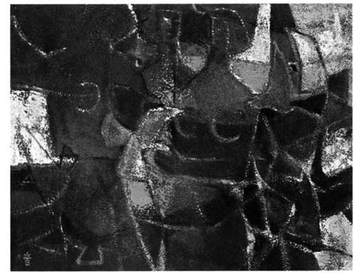
*第11回上野の森美術館大賞展(賞候補)* 鳥からの近況 (与板美術クラブ) 長谷川音松(下丁)