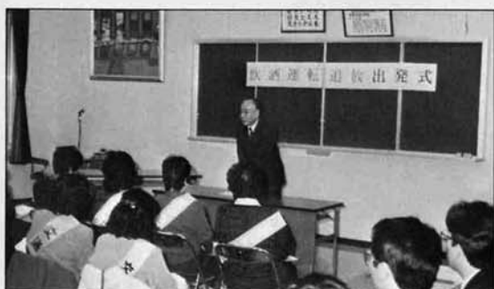
飲酒運転追放を目指し、出発式(与板警察署)に出席された皆さん

よいお年を 迎えて下さい と板協が歳末慰問 町社会福祉協議会が、 去る十二月十六日から 民生委員さんの協力を 頂き、歳末慰問を行 いました。 十二月十七日には、 郡内と長岡市の施設や 病院を回り、与板から 入所や長期入院してお られる方々へ、歳末見 舞金をお渡しして、大 変喜んで頂きました。