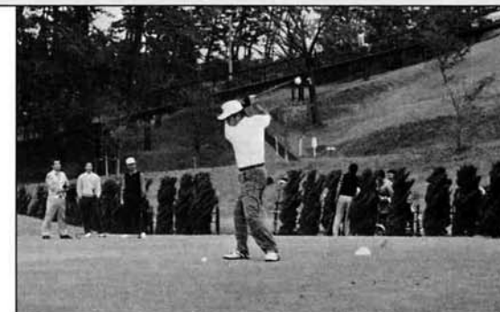
～ 第4回町民親善ゴルフ大会 ～