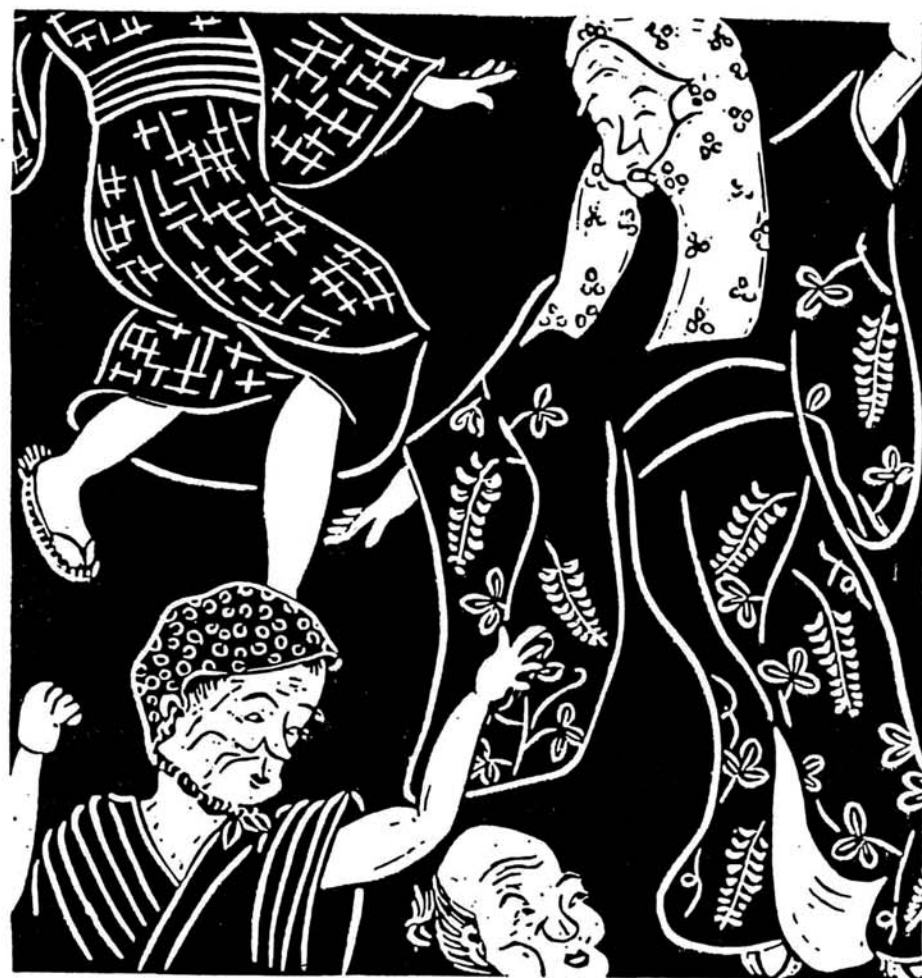
—平成5年10月10日(日)・11日(月)— 《記念講演》 第4回全国良寛サミット in 与板 桂枝雀

どこの町々村々でも、盆踊りは賑やかであった。盆だてがんに、なすの皮の雑炊だ、あんまり盛りつけられて鼻のてっぺん焼いたでんでらでんと、でっかいか、貰うて、二百十日の風よけだ。 提灯の揺れ、笛の音、太鼓の響き、闇に浮かぶ女しよの脛踊る、女装して、しなを作り。(はぎ)の白さちらり、クライ マックスになると、野卑の歌も飛び出る。その歌詞、こ、ではとても書けない。 さて、良寛在世当時の町村は、ゆっくり休めるのは盆と正月。その盆での最大娯楽が盆踊りで、あるから、みんなは解放感に浸って、日頃のうさをはらし、はめも外した。この雰囲気、良寛踊る、女装して、しなを作り。(布施一喜雄)