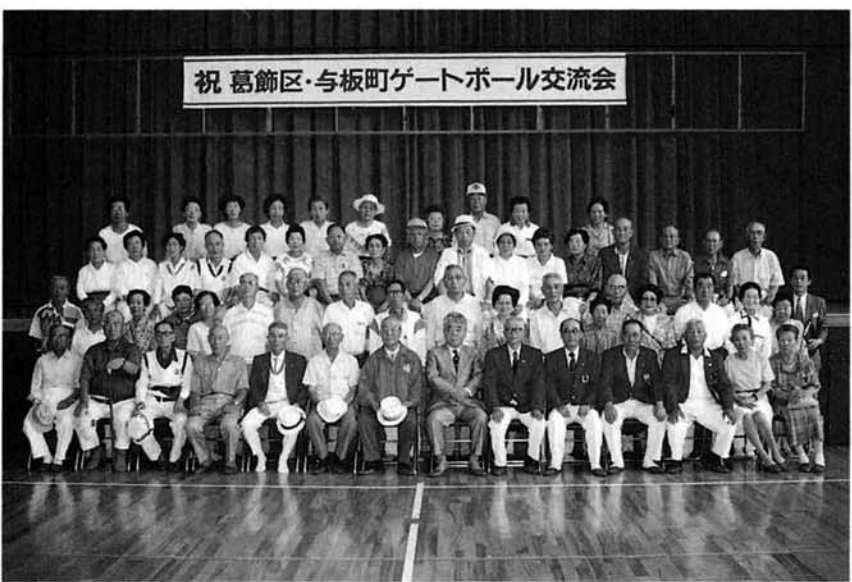
祝 葛飾区・与板町ゲートボール交流会

また、夏野菜だけでなく、秋のものという声も聞かれ、今年からは、新米コシヒカリ・与板のとれた野菜・くだもの・きのこのほか、わら細工の民芸品を詰め込んだ「お楽しみ急便」を企画しました。現在50件ほどの申込みをいただいております。新米と、野菜がとれる11月頃には都議会の方々のもとへ発送できるかと思えます。