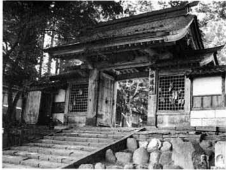
良寛ゆかりの徳昌寺

今年十月十日(日)に与板町を会場に第4回全国良寛サミットが開催されます。昨年の秋に町長の諮問によりサミット検討委員会が開かれ、その実施要綱が討議されました。それを受けて実行委員会が組織され、当日に向けて準備が進められております。