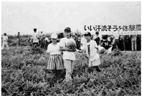
いい汗流そらぐ体験農