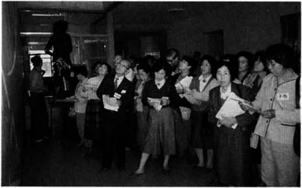
▲ 小中学校をはじめ各施設を見学