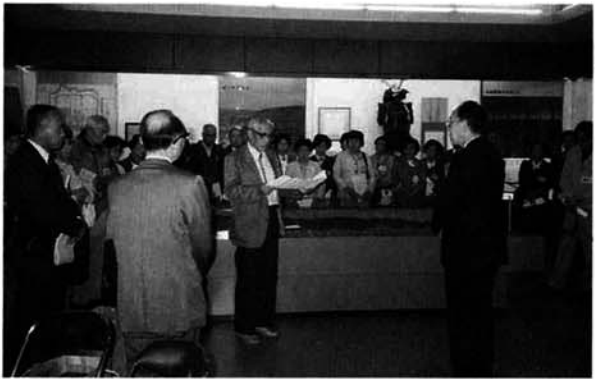
▲ 安中市長からのメッセージも届けられました