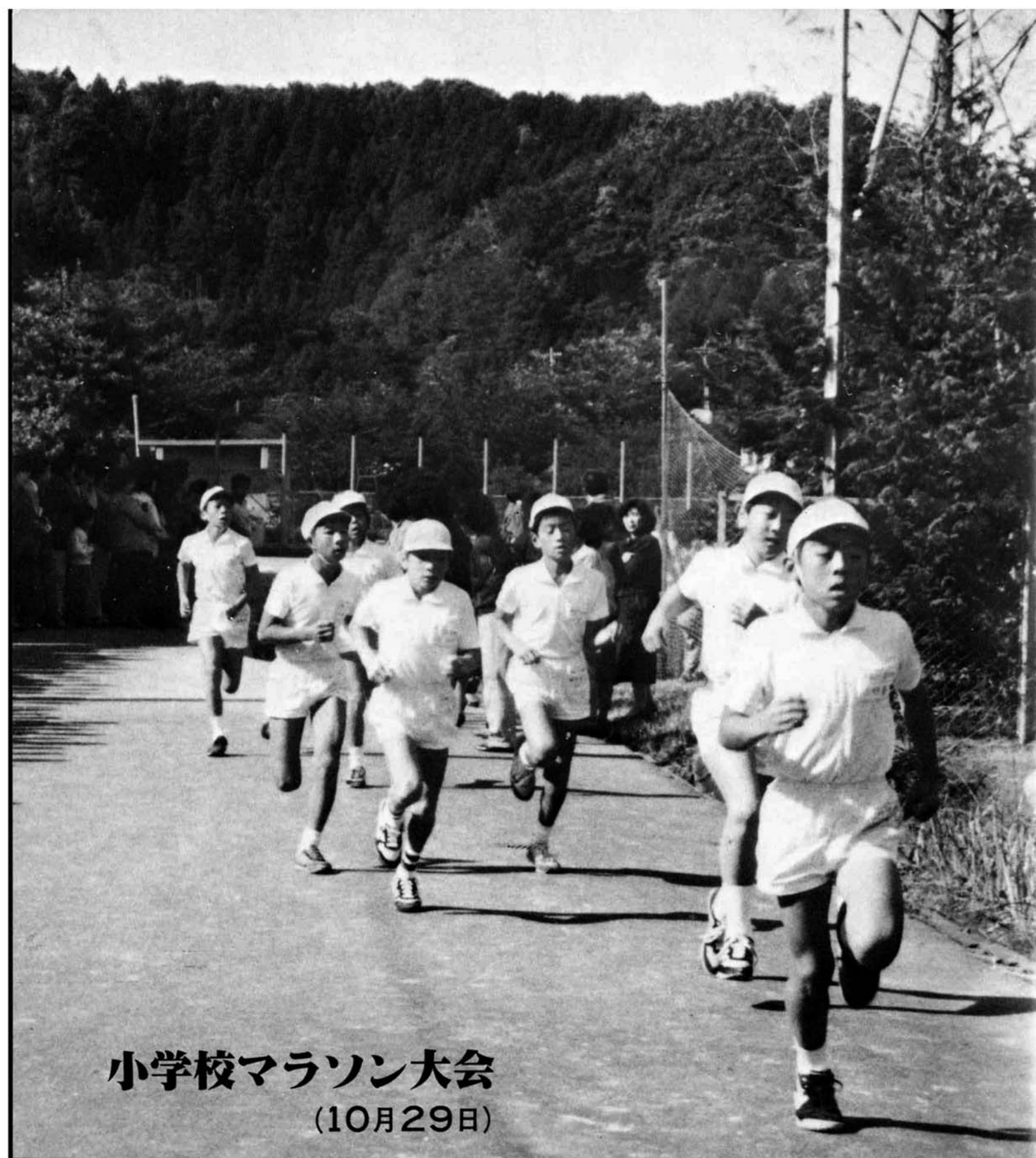
小学校マラソン大会 (10月29日)