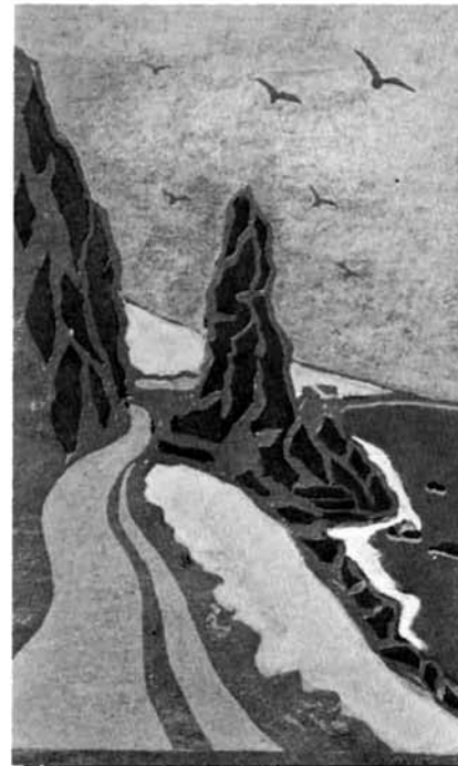
〈与板町版画クラブ〉