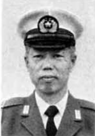
与板警察署 船見交通課長

日ごろ、交通事故防止のために活動されている町当局はじめ、町民の皆様に対し、この紙面をお借りして厚くお礼申し上げます。