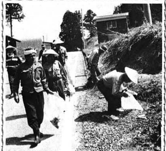
拾った空きかん120袋

い。出されたごみは、おむね十日から十二日までに収集作業をします。ごみが散乱しないよう、ビニール袋等に入れ、収集場に置いてください。鉄くず、空き缶などは、次の廃品回収まで保管しておきましょう。酒ビン、ビールビン、ジュースビンは販売店へ。