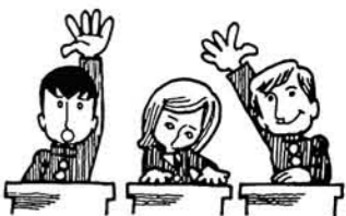
学校基本 調査から