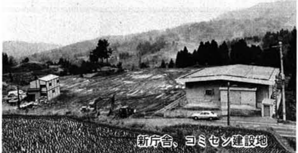
新庁舎、コミセン建設地

役場庁舎は鉄筋コンクリート四階建(一階は車庫等)延約一、八〇〇m。コミセンは二階延一、〇〇〇mで、ステージ付大ホール、研修室、調理実習室、保健相談室、談話室などを備え、村民交流の場や村造りの拠点として期待されています。また、診療所延二〇〇mはコミセン二階に併設され、内科、歯科などの診療を行います。