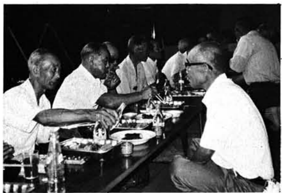
▲寺泊老人クラブと交流交歓会 8月11日に虫亀小で、海と山の老人クラブの活動について、意見交歓が行われた。