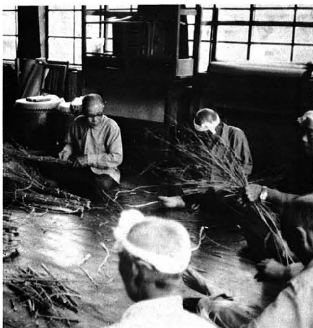
▲ホウキ、ゾウキン作り 神社、学校、保育所へ贈り、喜ばれた。