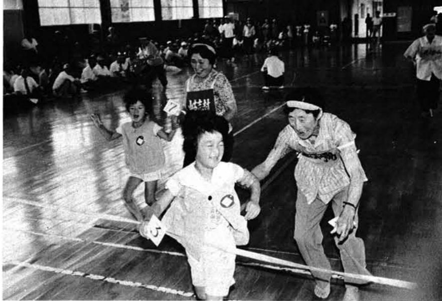
▲三古郡老人スポーツ大会 8月24日、山古志中学校で行われました。集まったのは、三島郡・古志郡の7町村に寺泊老人ホームの合わせて8チーム、450人のお年寄りです。

スプーンレース、玉入れ、400mリレーなど12種目に猛ハッスル。山古志村チームは抜群のチームワークを見せ、見事優勝を果しました。……写真は「お年寄りと孫の数字合わせ」、竹沢保育所の児童も協力してくれました。