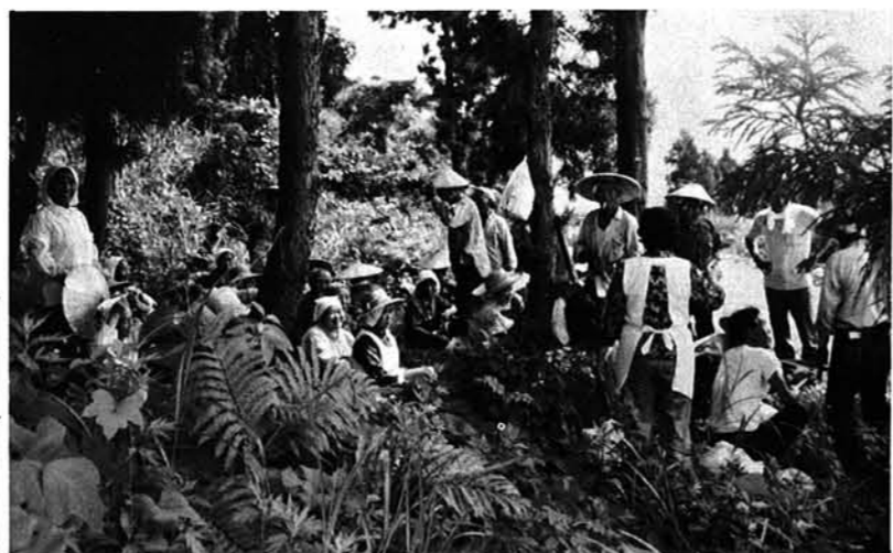
▲学校林の下草刈り 今年7月に41人で行った。豪雪だったため、太い杉まで倒れており作業は大変だった。

らは、学校林の下草刈り、花だん作りも始められ、会員の寄りもいっそう強まった。公民館や学校などとも交流が深まった。 「今年の秋は、保育所に、孫の木」を植えようと思っているんです。木の種類は決まっています。桐あたりはどうでしょう。 活動は今以上に、長く続けたいです。それには、まずよい指導者が必要です。冬場の活動も何か考えなければ……」と、意欲満々。