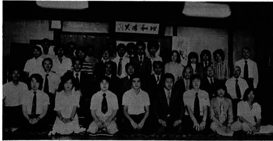
国民の祝日である「成人の日」(一月十五日)は各地で成人式が行われていますが、村では実情を考慮し毎年くりのべて成人式を実施しています。

一、ふるさと意識を育てるために、家庭教育をどのようにすすめるか。二、地域に立脚したPTA活動を