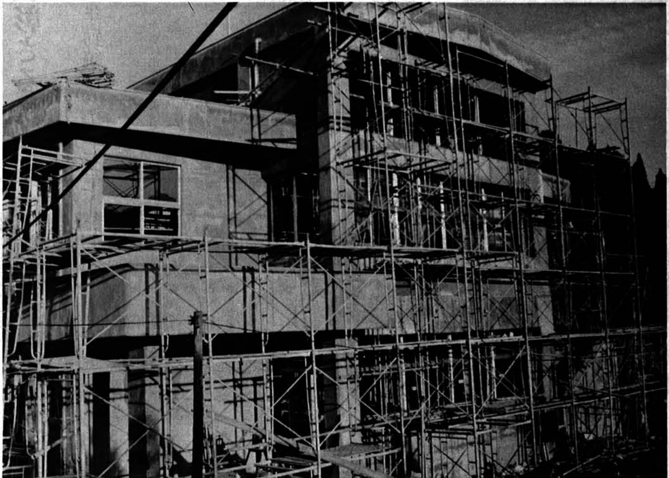
近代化する竹沢保育所の完成も間近かに……

1975 12/1 第90号 発行 新潟県古志郡山古志村役場 電話 竹沢局 17 23 78 印刷 大川印刷株式会社