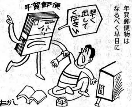
年賀郵便物はなるべく早目に

税金が免除される制度があります。このほか間接的には入場税、揮発油税などがありますので詳しいことは税務署へお尋ねください。