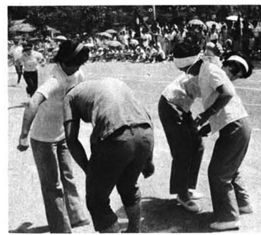
「手をつかわずに」くびわりレ