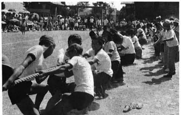
「老若男女一体となって」綱引きの部落対抗

ことしで6回目を迎えた総合レクリエーション大会（親善運動会）は、8月21日虫亀会場で開催されました。幸い天候にも恵まれ、各部落から多数の人たちが集まり、だれでも参加できるレクリエーションの種目を声援のなかで次々と消化し、村民の親善融和と体力づくりに大きな成果をあげました。