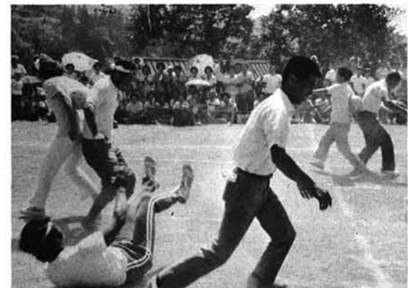
「呼吸が合わず、スッテンコロリ」