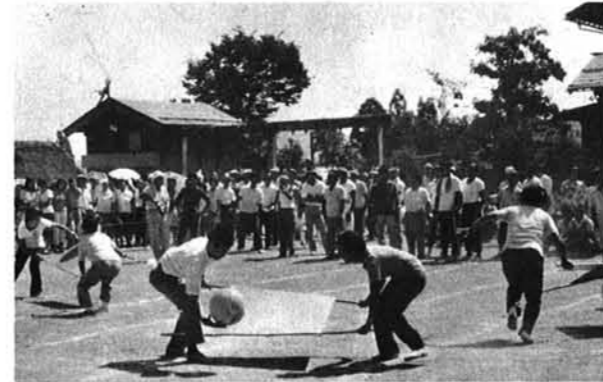
「落さぬように」 風船おくり