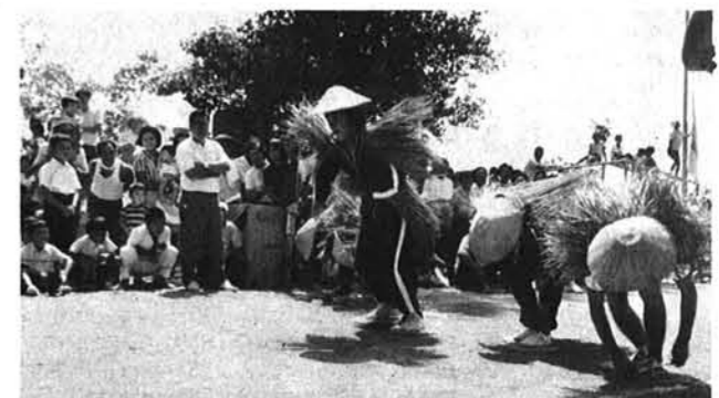
「誰が早いか、ミノカサつけて」 仕度競争