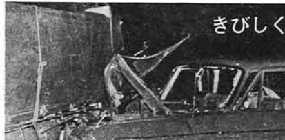
きびしくなった道交法

秘密は守られる 国勢調査は、このように個人や世帯について調査しますが、個人や世帯の秘密を明らかにしたり、統計以外の目的に使うことは法律で厳しく禁止されています。